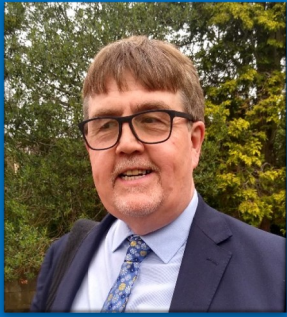
Gair gan y Gweinidog

Blwyddyn newydd dda iawn i bawb ohonoch. Bu 2025 yn flwyddyn brysur i eglwys Ebeneser, yn llawn gweithgareddau a thystiolaeth i gariad Duw yn Iesu. Diolch o galon i bawb ohonoch fu'n rhan o drefnu a chynnal y gweithgareddau hynny.