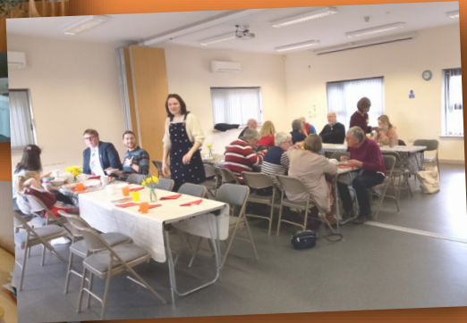
Dathliad Gŵyl Ddewi