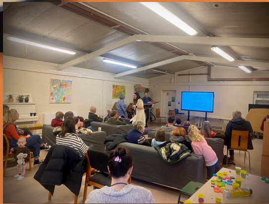
Un o gyfarfodydd Angor Grangetown.