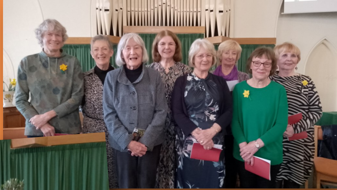
Aelodau o gapeli Cymraeg Caerdydd gymerodd ran yng ngwasanaeth Dydd Gweddi'r Byd 2024.